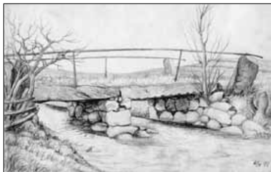
Bro over Stavis Å