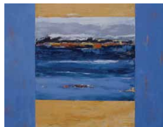
Kirsten Bechmann, Island, 90x120 cm.

Begge kunstnere har tidligere været vore udstillere i sognegården, så en udførlig præsentation er ikke nødvendig, selvom begge har udviklet nye interesser inden for kunsten. Det djærve og det feminine er bibeholdt.