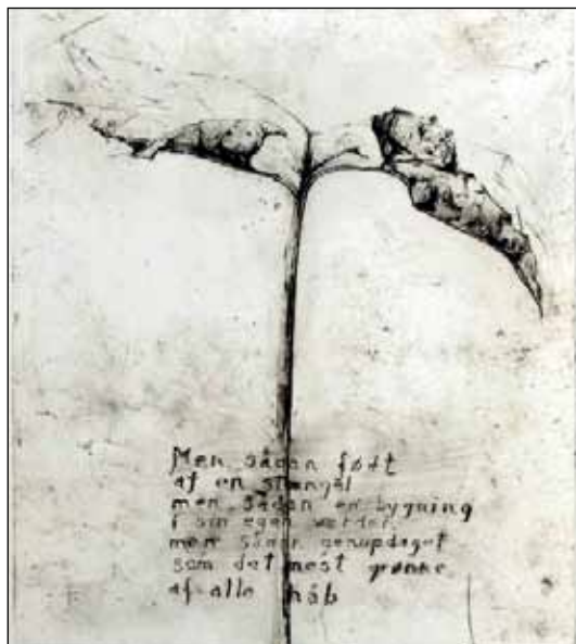
Birgitte Thorlacius laver grafik.

Søndag d. 6. februar kl. 15: Fernisering med Birgitte Thorlacius og Frede Troelsen