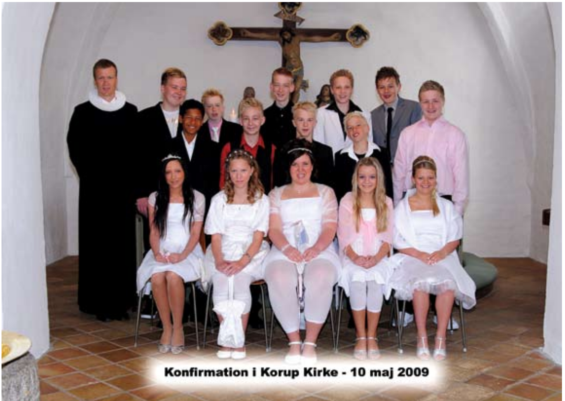
Konfirmation i Korup Kirke - 10 maj 2009