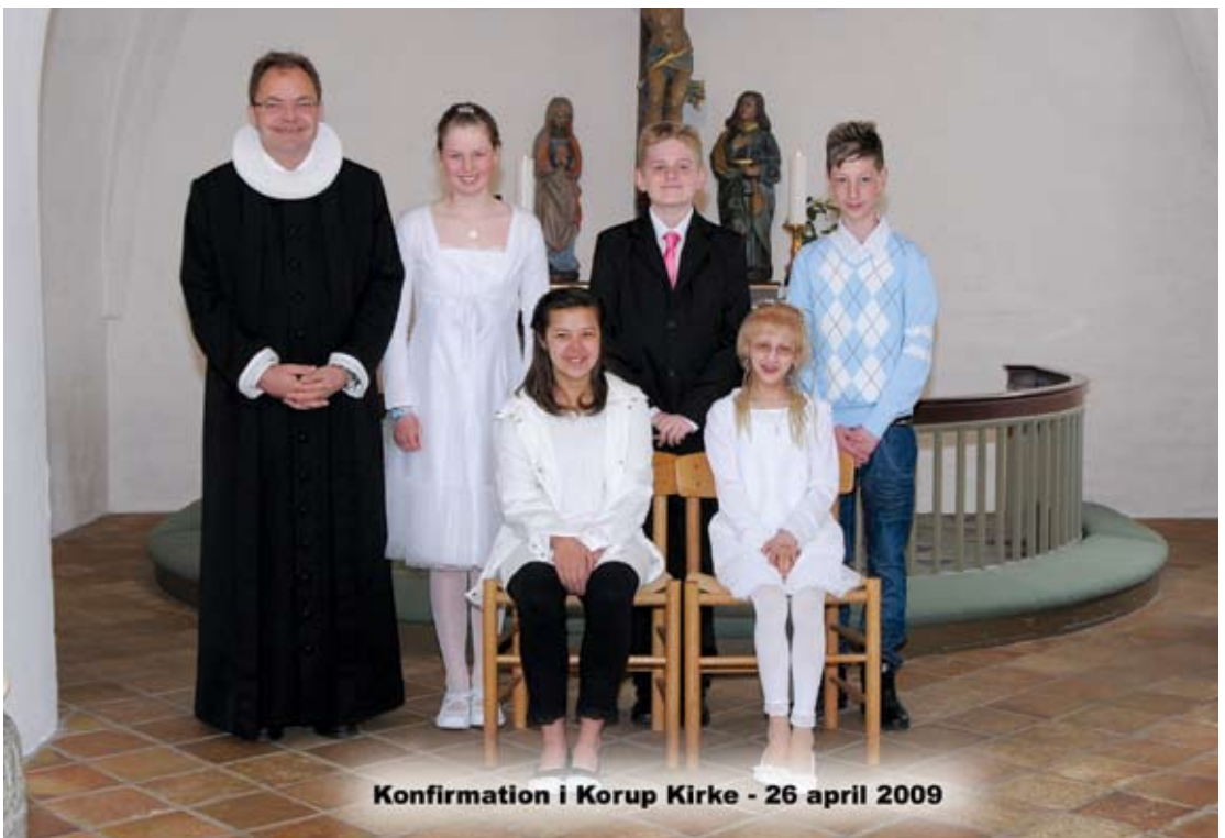
Konfirmation i Korup Kirke - 26 april 2009